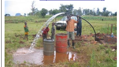
De nieuwe water-put geeft veel water!