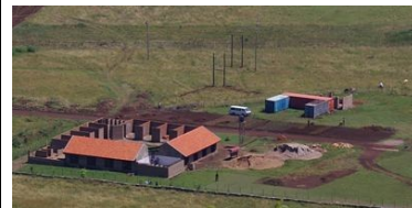
De Bouw vanaf de berg