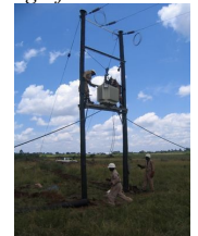
de eerste steen – Stroom-voorziening Aug-07 Aug-08