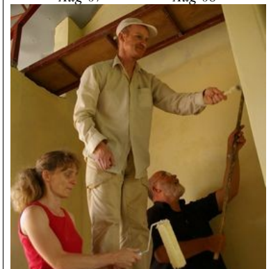
German Painters at Work