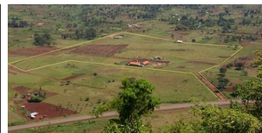
Osia-Zicht Aug-08, de gele lijn laat de grens zien

Als u een goede gebeds-held bent, dan willen we u vragen om met ons mee te bidden. Onze dromen zijn nog steeds erg groot en daar is nog steeds heel veel support voor nodig. En dan de sponsoring voor de kinderen... We geloven dat dit allemaal goed gaat komen maar toch willen we u vragen mee te bidden daar voor want we verwachten alles van de Heer, niet van ons eigen "fonds-werving talent"(want dat hebben we ook helemaal niet)